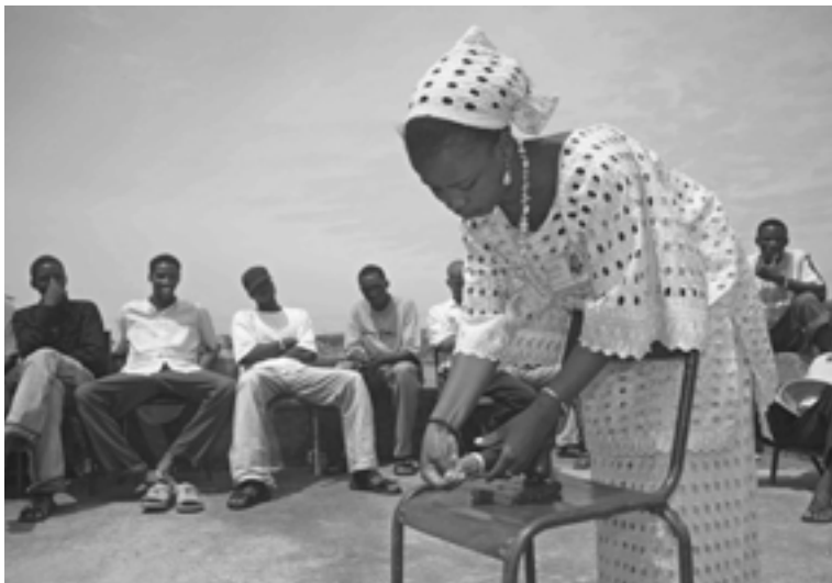
Eine Ärztin unterrichtet junge Männer über AIDS-Verhütung.

Diese Worte gingen wie ein Blitz um den Planeten und lösten stürmische und kontroverse Reaktionen