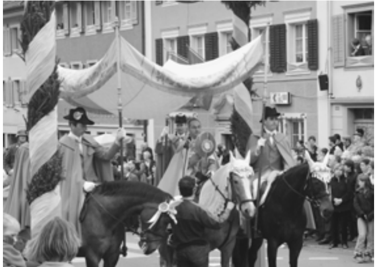
Selbst der Heiland hoch zu Ross: Einzug in Beromünster

Unter dem Triumphbogen richtet der Festprediger herab vom Pferd