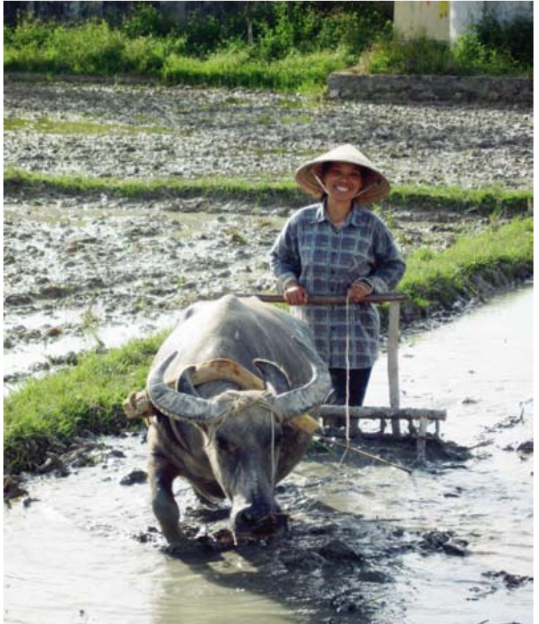
Der Mensch lebt weder vom Brot noch vom Glauben allein.

In der oben zitierten Rede Jesu an seine Nachfolger heisst es weiter: «Wer glaubt und sich taufen lässt, wird gerettet; wer aber nicht glaubt, wird verdammt werden.» Jahrhundertlang war die allzu wörtliche Gleichsetzung von «nicht glauben» und «verdammt werden» Motivation für viele Missionare in ihrer Zeit, die armen Seelen der «Heidenkinder» vor der ewigen Verdammnis retten zu wollen. Eine Strategie von «Lass dich taufen oder du bist verloren!» war die Folge. Da ist mir der Wahlspruch des heiligen Ignatius von Loyola doch sympathischer, der das Ziel seiner Mission mit den «Seelen helfen» umschrieben hat. Darin steckt für mich eine wohlwollende Ehrfurcht eines seelsorglichen Wirkens. Wer anderen Menschen die erlösende Botschaft Jesu vermitteln will, steht nicht erhaben über dem Abgrund, aus dem andere errettet werden müssten. Viel-