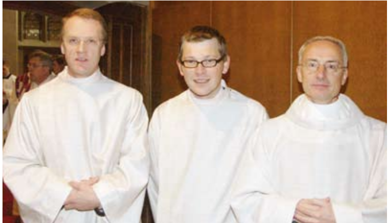
Priester. Diakon oder Laie? Richtige Lösung bitte ankreuzen.

Ein weiterer Grund für die sinkenden Priesterberufungen steckt in der Fusion von Pfarreien zu immer grösseren Pastoralräumen, denen laut Kirchenrecht stets ein Priester vorstehen muss. Diese beklagen sich zu-