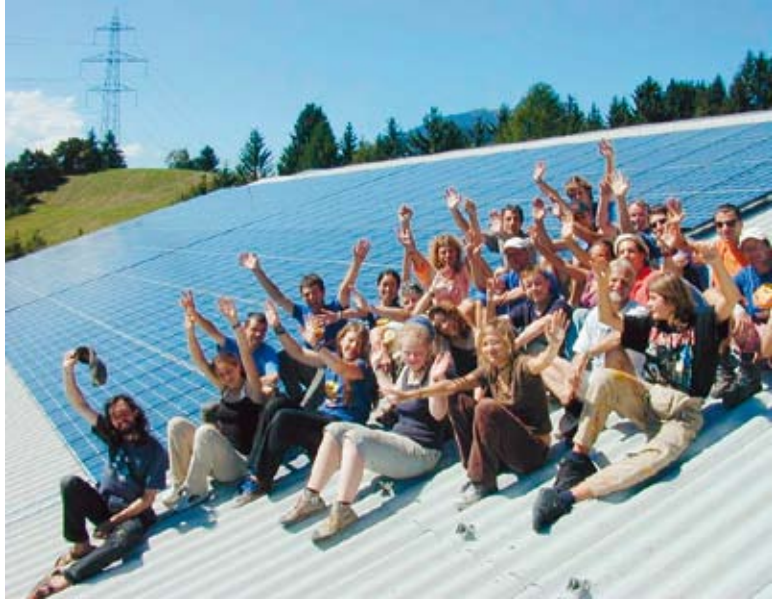
Das «Kantidach erweitern»: Schüler bauen am Alpenquai eine Solaranlage.

Die kleinen Versprechen lauten etwa: Bis 3 Stockwerke laufe ich, ich tausche innerhalb der nächsten 5 Tage sämtliche Glühbirnen durch Sparlampen aus, ich kaufe Elektrogeräte mit Energieklasse A bis A++, ich kaufe nur aufladbare Batterien, ich kaufe grosse Getränkeflaschen statt kleine Fläschchen, ich tränke meine Pflanzen mit Regenwasser, ich ermutige meine Gemeinde zum Bau von Solaranlagen und Minergie-Gebäuden, ich koche das Teewasser und Wasser für Nudeln und Reis im Wasserkocher, ich stelle keine warmen Speisen in den Kühlschrank, ich wähle Feriendestinationen nach ökologischen Gesichtspunkten, ich fahre an Orten ohne Beschneigungsanlage Ski, ich stelle Elektrogeräte mit Stand-by-Modus mit einer schaltbaren Steckdosenleiste