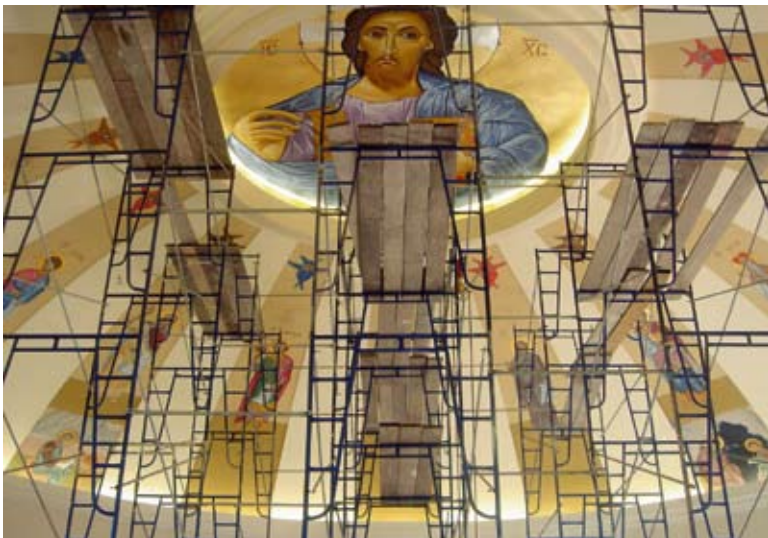
Wo sollen die Kirchgemeinden bei sinkenden Kirchensteuereinnahmen sparen?

Die Rechte und Privilegien der drei Landeskirchen (reformierte, römisch-katholische und christkatholische Kirche, in einigen Kantonen auch die jüdischen Gemeinschaften) bestehen in der Erhebung von Kirchensteuern bei natürlichen und juristischen Personen, der Präsenz in staatlichen Medien, dem konfessionellen Religionsunterricht an staatlichen Schulen, dem staatlichen Unterhalt theologischer Fakultäten, der Befreiung kirchlicher Mitarbeiter vom Militär usw. Auf der anderen Seite haben die öffentlich-rechtlich anerkannten Kirchen die Pflicht, demokratisch ge-