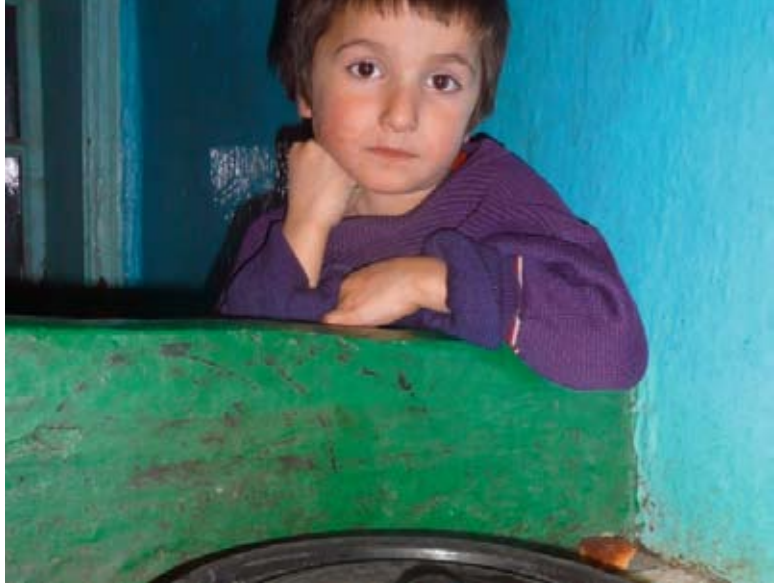
«Wer ein Leben rettet, rettet die Welt»: moldawisches Kind in Suppenküche.

Seit 2004 ist CONCORDIA in Moldawien aktiv. Das zwischen Rumänien und der Ukraine gelegene Land steht vor enormen Problemen: Ein grosser Teil der arbeitsfähigen Bevölkerung lebt im Ausland, da es zu Hause keine Beschäftigung gibt. Zurück bleiben Kinder und Alte.