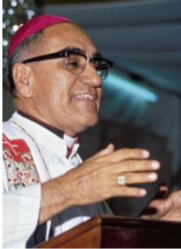
Die Stimme der Armen kann man nicht töten: Oscar Romero.

Vom Zweiten Vatikanischen Konzil hatte Romero gelernt, dass die Kirche sich wie Jesus in die Belange der Welt einzumischen hatte. «Die Hauptaufgabe der Kirche besteht darin, der Welt zu dienen, sie in ihrer Gesamtheit zu retten, und dies heute, in ihrer geschichtlichen Gegenwart.» Um diesen Dienst zu leisten, muss die Kirche selbst umkehren. Diese Einsicht übernahm Romero den Texten der Versammlung der lateinamerikanischen Bischofskonferenz von 1968 in Medellín: «Wir haben den Glauben vom Leben getrennt. Wir begnügen uns, den Glauben zu bekennen oder