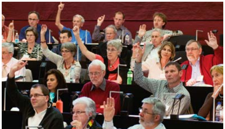
Die Synode bemüht sich um einen fairen Finanzausgleich in den Gemeinden.