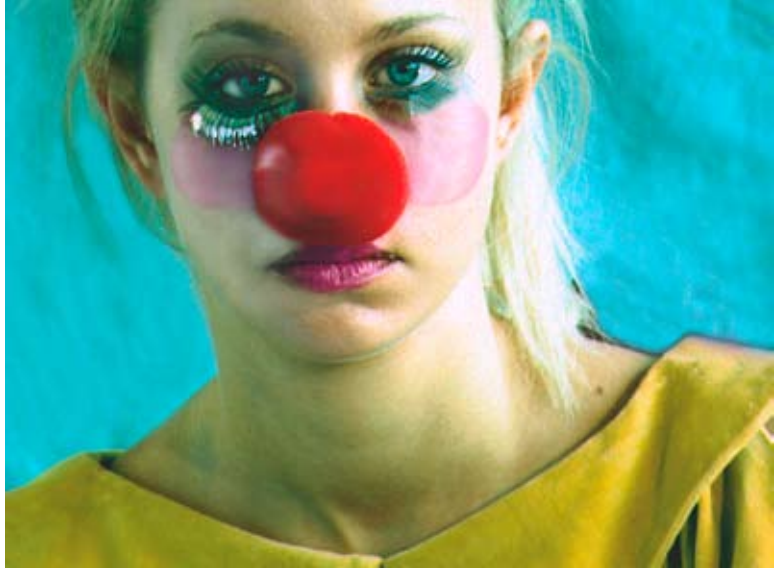
Es ist nicht alles Gold, was glänzt...: Viele Circus-Artisten leiden Not.