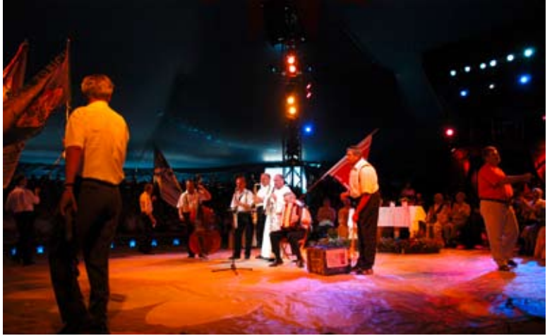
Der Circus-Gottesdienst Ende Juli auf der Luzerner Allmend füllt das Zelt im