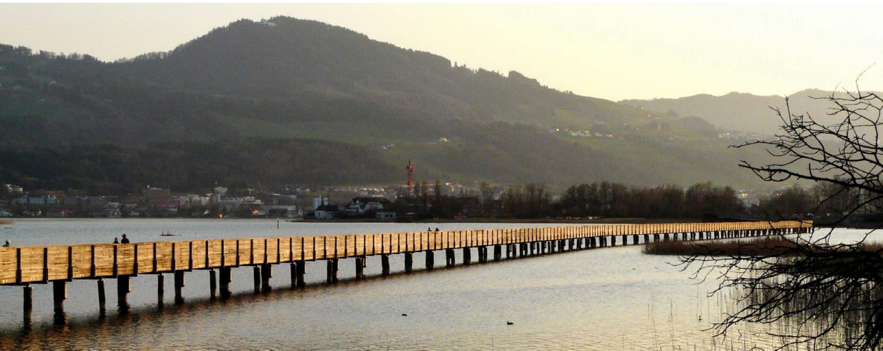
Pilgersteg zwischen Rapperswil und Hurden.