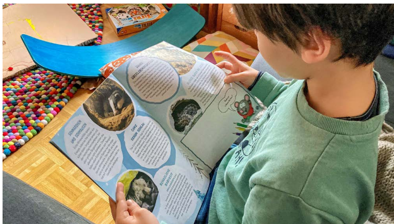
Informationen, angereichert mit vielen Bildern und kindgerecht gestaltet: das neue Magazin der Steyler Missionare.