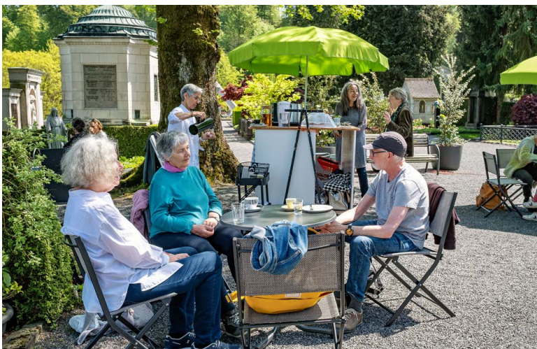
Das Friedhofscafé im Friedental im Mai 2023. Es öffnet Mitte Mai wieder am gleichen Ort auf dem Platz mit der grossen Linde.

Pro Senectute Luzern, Maihofstrasse 76, Luzern, 041 319 22 80 | lu.prosenectute.ch, Suche nach «Steuerklärungsdienst»