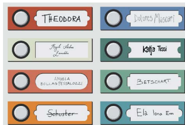
Wie viel verrät ein Name?