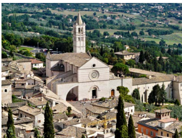
Blick auf die Basilika Santa Chiara in Assisi.

So, 30.6. bis So, 7.7. | mit Niklaus Kuster, Kapuziner; Nadia Rudolf von Rohr, Franziskanische Gemeinschaft; Eugen Trost, Uni Luzern | Kosten: Kurs Fr. 250.–, Logis Fr. 490.–, Reise Fr. 250.– bis Fr. 300.– | Anmeldung bis Ende April unter tauteam.ch/angebote/reisen