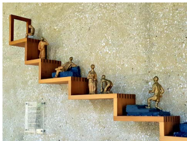
Der Lebensweg als Treppe dargestellt im Kloster Baldegg.