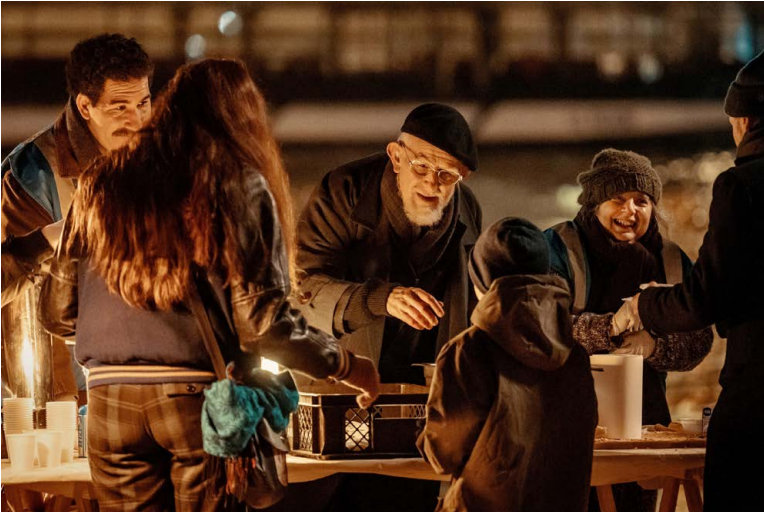
Abbé Pierre half Menschen, die von den Nazis verfolgt wurden, über die Schweizer Grenze. Später engagierte er sich für Obdachlose.