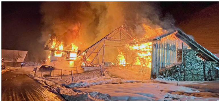
Das war für die Notfallseelsorge ein Grosseinsatz: der Brand in Wiggen am 22. Januar dieses Jahres.

figste Einsatzgründe waren erneut ausserordentliche Todesfälle (31, Vorjahr 30) und Suizide (25, Vorjahr 20). Täglich sind zwei Notfallseelsorgende und Care Givers auf Pikett. Aufgeboten werden sie vom Rettungsdienst 144, von der Polizei oder der Feuerwehr. Grosseinsätze gab es 2023 keine. Der letzte liegt zwei Monate zurück, als in Wiggen in der Gemeinde Escholzmatt drei Kinder bei einem Brand ums Leben kamen.