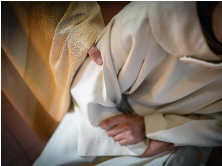
Fast zwei Drittel der seit September gemeldeten mutmasslichen Übergriffe betreffen Jungen, die Täter sind mehrheitlich männlich.

Bei 58 dieser Meldungen geht es um sexuelle Handlungen mit Kindern. Täter und Betroffene sind grossmehrheitlich männlich. Zwei der Fälle sind nach dem Jahr 2000 geschehen. Bei fünf dieser Meldungen geht es um Geschlechts-, Oral- oder Analverkehr. In 20 Fällen steht der Vorwurf der Berührung von nackten oder bekleideten Körperteilen im Raum, 11 Meldungen betreffen sexuell motivierte Äusserun-