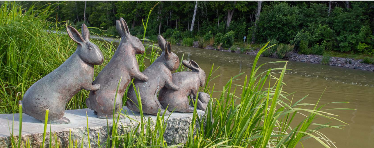
(Oster-)Hasengehoppel: Kunstwerk am Göta-Kanal in Söderköping in Südschweden.