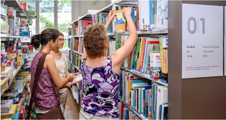
Die Kirchensteuern von juristischen Personen müssen im Kanton Luzern für Soziales und Kultur verwendet werden – zum Beispiel für die «kirchlichen Medien» im Pädagogischen Medienzentrum Luzern.