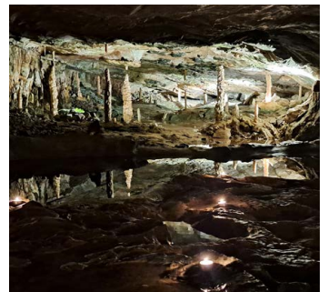
Ein beliebtes Ausflugsziel: die Beatushöhlen bei Interlaken.