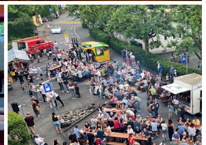
Bunte Kirche: die «Lange Nacht der Kirchen» vom 2. Juni 2023.