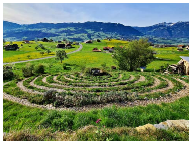
Der Sommercampus wartet mit ökospirituellen Impulsen auf. Im Bild: das Pflanzenlabyrinth im Garten des Zentrums Ranft.

Sa, 3.5., 09.15–15.45, Treffpunkt katholische Kirche Greppen | bei jedem Wetter | Anmeldung bis 30.4. an sekretariatseepfarreien.ch | Infos: seepfarreien.ch