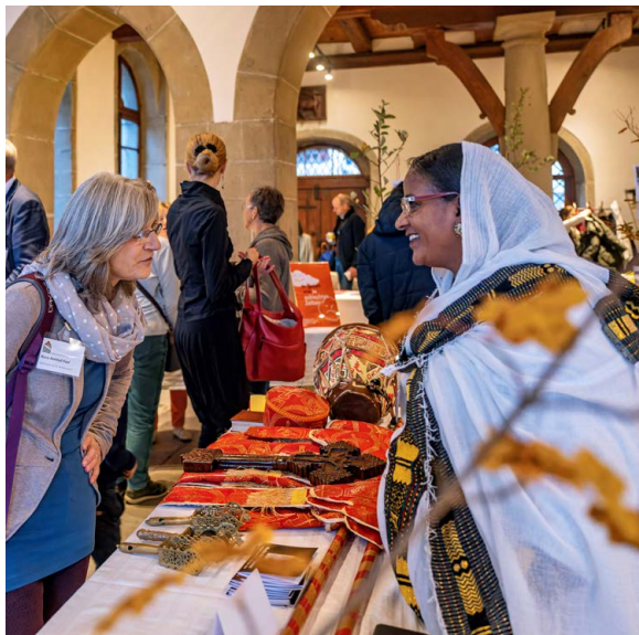
Bunte Religionsvielfalt: an der letzten Veranstaltung «Unter einem Dach» im September 2022.