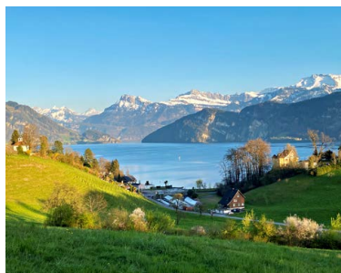
Auf einer gemeinsamen Wanderung sakrale Orte der Seegemeinden neu entdecken.

In welcher Welt will ich leben? Was ist wesentlich und macht Sinn? Solchen Fragen geht der erste Sommercampus im Zentrum Ranft nach: Workshops mit ökospirituellen Impulsen aus Gegenwartsliteratur und christlicher Mystik, Zubereitung veganer Gerichte, Auseinandersetzung mit «Tiefenökologie». Dazu können Meditation, Yoga oder Klangschalen ausprobiert werden. Begleitprogramm für Kinder. 13.–18.7., Zentrum Ranft, Flüeli-Ranft | Anmeldung und Infos: zentrumranft.ch