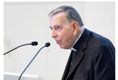
Kardinal Kurt Koch hielt im November einen Festvortrag an der Uni Luzern.

Littau ist die zweite Luzerner Kirchgemeinde, die das Umweltlabel «Grüner Güggel» führt. Die Auszeichnung wurde ihr am 6. April im Sonntagsgottesdienst übergeben. Die Kirchgemeinde Luzern arbeitet bereits seit November 2022 mit dem «Grünen Güggel». Buchrain peilt die Zertifizierung im Herbst an, die reformierte Kirche Meggen-Adligenswil-Udligenswil ist ebenfalls auf dem Weg dazu. Der «Grüne Güggel» hilft den Kirchgemeinden, ihre Umwelleistung zu verbessern. Das Label wird von der Fachstelle «oeku – Kirchen für die Umwelt» vergeben.