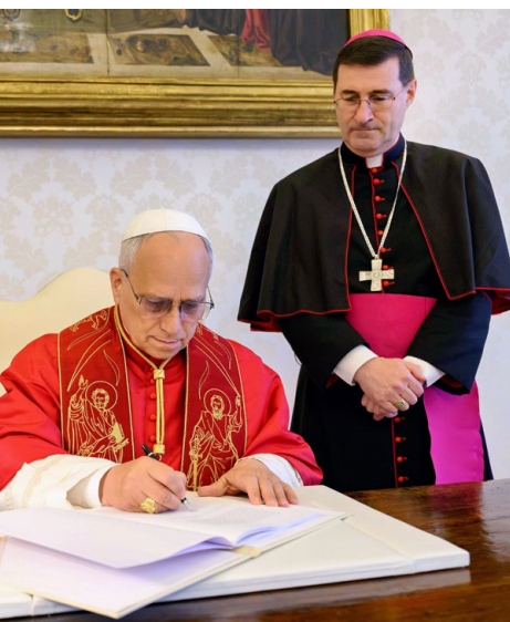
Papst Leo XIV. unterzeichnet die Enzyklika «Magnifica humanitas – über die Bewahrung des Menschen im Zeitalter der künstlichen Intelligenz».

Für Leo ist Wahrheit ein Gemeingut des demokratischen Lebens. Das heisst: Wer die Wahrheit untergräbt – mit Fake News, Deep Fakes oder polarisierenden Narrativen –, der untergräbt auch die Demokratie. Ausserdem kann es Wahrheit für Leo nur geben, wo Verantwortung und Vertrauen bestehen. Das heisst, Wahrheit muss verhandelt werden. Sie ist kein fertiges Gebäude aus dogmatischen Grundsätzen, die wir einfach umsetzen oder verkündigen sollen. Es ist bemerkenswert, dass ein Papst das so schreibt.