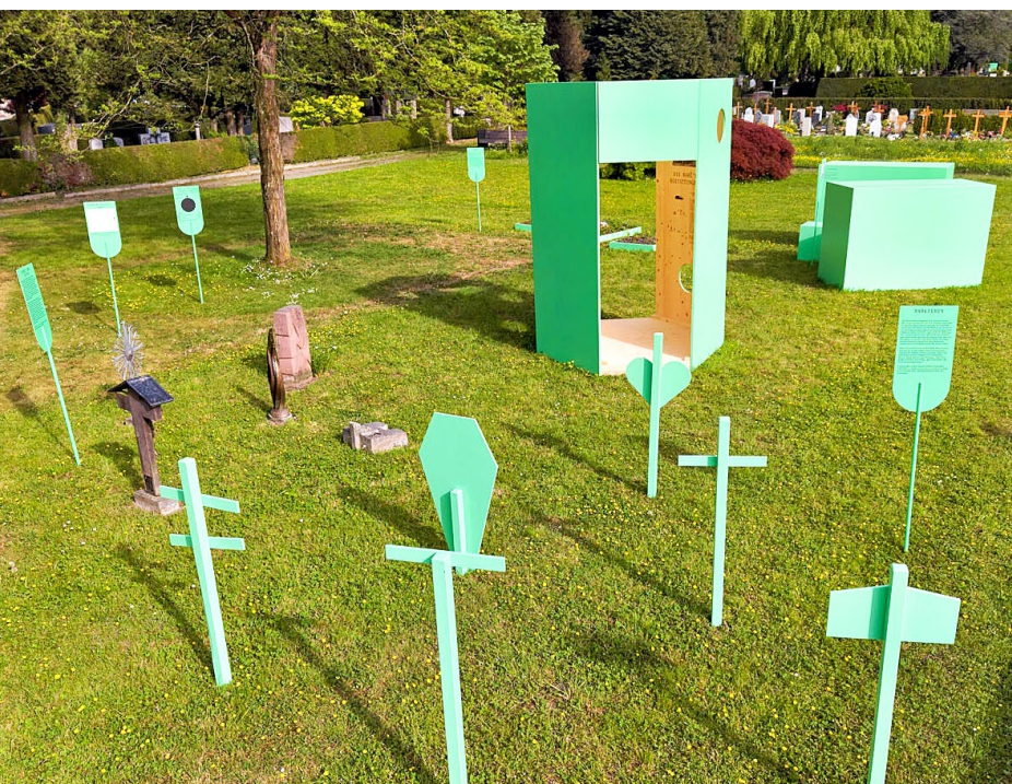
Schautafeln mitten auf dem Friedhof erläutern Bräuche und Rituale rund um die Bestattung.

So erfahren Besucher:innen gleich beim Eingang des Friedhofs, dass «Andersgläubige» erstmals 1782 eine letzte Ruhestätte auf dem Friedhof des damaligen Bürgerspitals fanden. Als 1885 der städtische Friedhof Friedental eröffnet wurde, war es Katholik:innen noch nicht erlaubt, sich kremieren zu lassen. Gleichwohl wurde eine Parzelle für den Bau eines Krematoriums