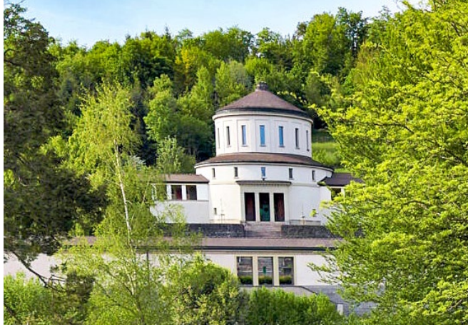
Das alte Krematorium auf dem Friedhof Friedental in Luzern.