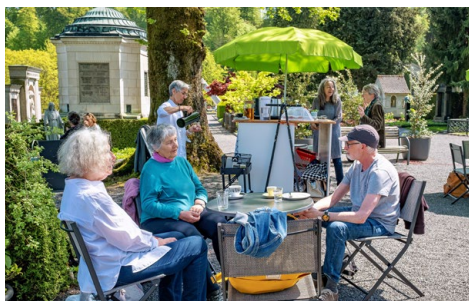
Das Friedhofscafé in einer Aufnahme vom Mai 2023, kurz nach der Eröffnung.

Das Café, das jeweils im Sommerhalbjahr betrieben wird, blickt auf ein «erfolgreiches Jahr 2023 mit hochmotivierten Freiwilligen» zurück und steht mitten in der vierten Saison. Den Betrieb ermöglichen 50 Freiwillige und 20 Personen, die Kuchen backen.