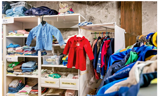
Der «Offene Kleiderschrank» befindet sich in einem Raum des Murihofs im Surseer Kirchenbezirk.

Kleider und Schuhe, Taschen, allerlei Accessoires, Schulrucksäcke oder Bettwäsche: Die Auswahl ist breit. Im grossen Raum im Murihof im Surseer Kirchenbezirk gehen Menschen ein und aus, die ihr Geld gut einteilen müssen: Armutsbetroffene aus Sursee und Umgebung. Im «Offenen Kleiderschrank» können sie sich kostenlos bedienen. Diese Möglichkeit nutzten letztes Jahr um die 100 Familien, 400 bis 500 Personen insgesamt. Letztes Jahr war der Kleiderschrank an 54 Halbtagen offen. Freiwillige – zurzeit elf – prüfen und sortieren, was Monat für Monat angeliefert wird: 40 bis 50 Säcke.